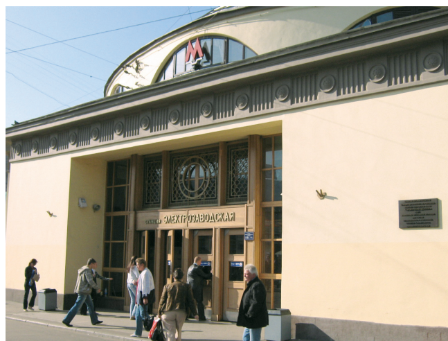
Рис. 1. Наземный вестибюль станции метро «Электровзаводская», Москва

Отличительной особенностью краски ВД-АК-1505 является ее кислый характер ( \text{pH} < 5 ) в отличие от подавляющего большинства традиционных красок с \text{pH} = 8-10 . Это обуславливает хорошую адгезию получаемых покрытий к минеральным основаниям. Высокое качество краски ВД-АК-1505 и покрытий на ее основе подтверждено положительными результатами испытаний, выполненных в ЦНИИ транспортного строительства (ЦНИИС), ЦНИИ морского флота (ЦНИИМФ) и НИИ железобетона (НИИЖБ).