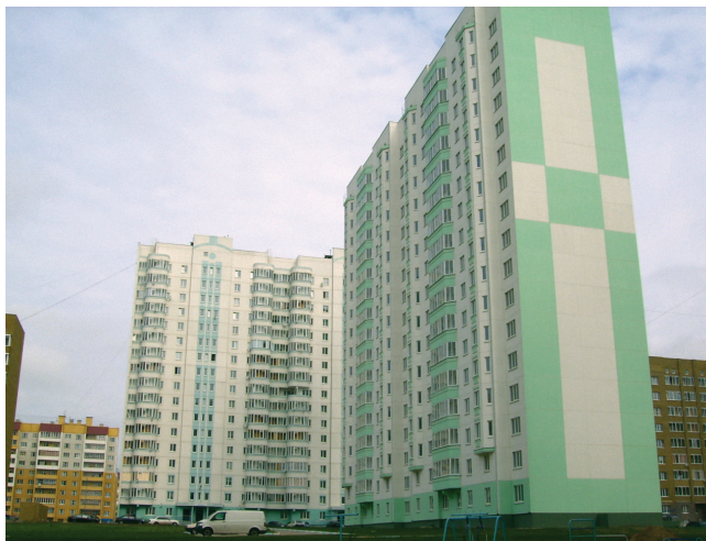
Рис. 3. Комплекс жилых домов, Курск

Специалистами ООО «Латом-БИС» на основе компонентов из недефицитного отечественного сырья разработана рецептура краски ВД-АК-1505КС для защиты поверхностей бетона. При выборе пленкообразователя для защитных покрытий бетона одним из главных критериев является низкое водопоглощение покрытий и их способность пропускать водяные пары (паропроницаемость), что позволяет подложке «дышать». Как отмечалось выше, паропроницаемость — одна из важней-