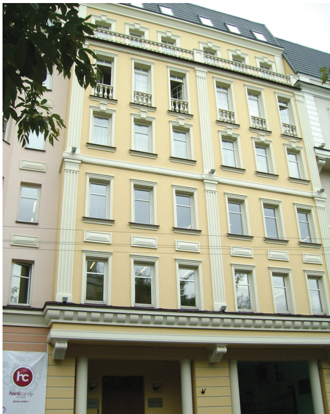
Рис. 2. Офисный центр, Москва

Вместе с тем рецептуры акриловых ВД-красок недостаточно совершенны. Существуют возможности для дальнейших инноваций: используя современные функциональные добавки, можно в широком диапазоне регулировать защитно-декоративные свойства и долговечность покрытий. Для регулирования паропроницаемости и гидрофобности защитных покрытий в рецептуре новой краски можно использовать гидрофобизирующие добавки на основе кремнийорганических соединений — полиакрилсилоксаны.